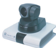
Vega Pro S