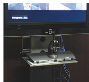
本社のVegaX5はキャスター付きラックに収容し、参加人数に応じて会議室を移動する