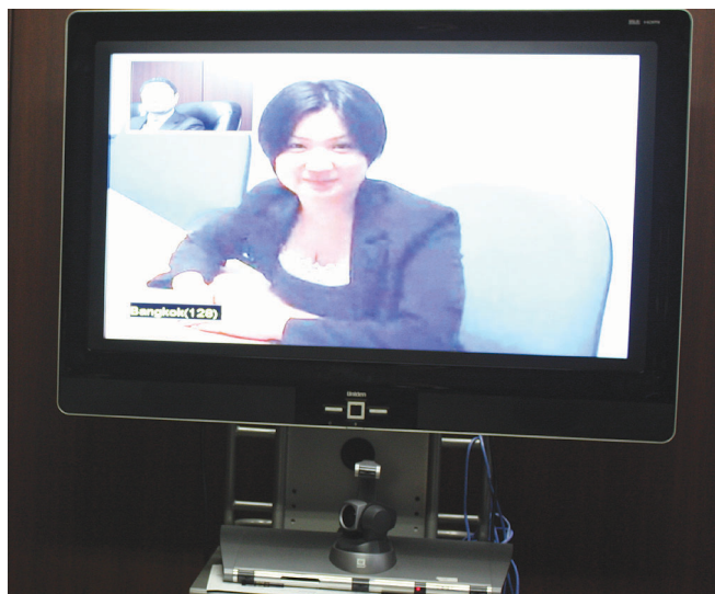
本社とタイ・バンコクとの1対1接続風景